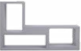
Grey / grigio