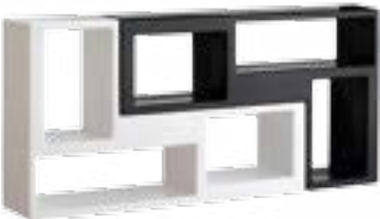
White / Black bianco / nero