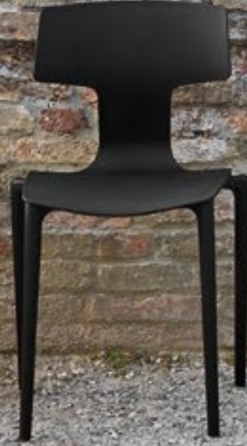
Nero Black Negro NCS S 9000-N