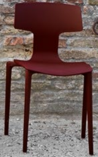
Melanzana Aubergine Berenjena NCS S 5540-Y90R