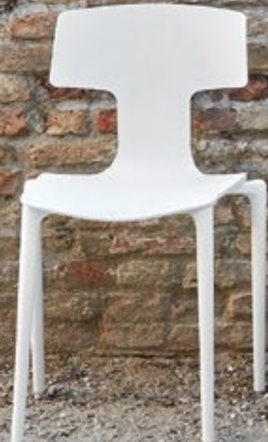
Bianco White Blanco NCS S 0500-N