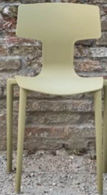
Sabbia Sand Arena NCS S 3010-Y