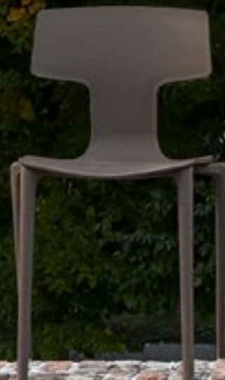
Grigio caldo Warm Grey Gris Caliente NCS S 6005-Y20R