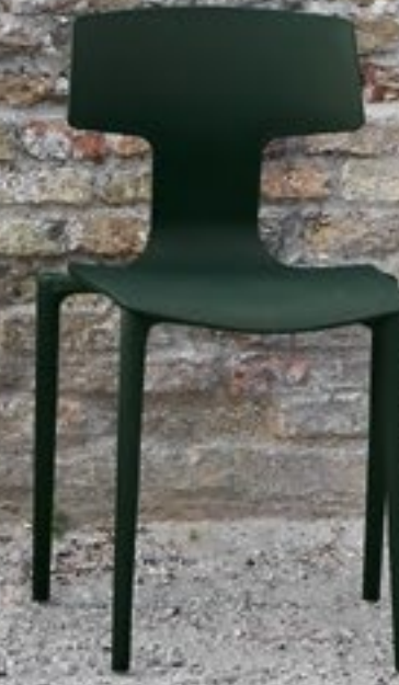
Verde scuro Dark Green Verde oscuro NCS S 8010-G10Y